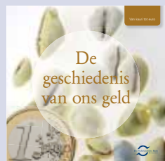
'De geschiedenis van ons geld'