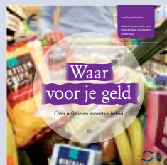
'Waar voor je geld' praktische lesopdrachten tweede fase havo/vwo