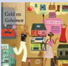
'Goud, Geld en Geheimen' publieksbrochure