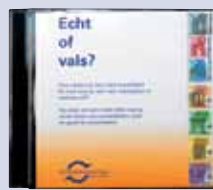
'Echt of vals?' cd-rom met de echt- heidskenmerken van de eurobiljetten